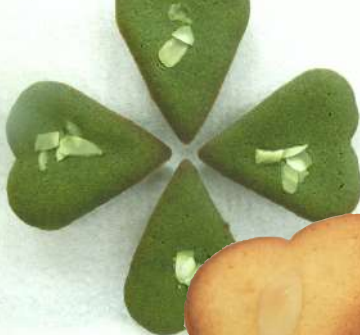
抹茶フィナンシェ フィナンシェ(グリーン) 各種 1個100円