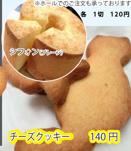
シフォン(グリーン)