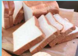
レギュラー【角】 300円(税込)