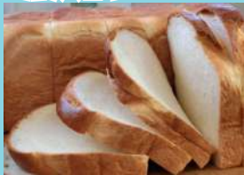
レギュラー【山】 300円(税込)